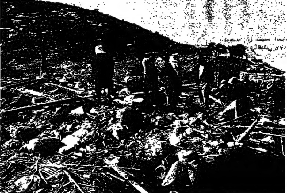
هكذا كانت «العزية» أمس ، بحث عن مفقود

العزية - من نزيه نقوزي : واصلت مخيمية المدعو الاسرائيلي امين تصفها لبعض قرى القطاع الغربي ، في حين استمرت الطائرات الحربية الاسرائيلية بتفجير قرى القرى الجنوبية ، وخصوصا فوق المناطق التي تعرضت اول من امس لعمليات القصف الجوي . وقصدت وصلت الطائرات الاسرائيلية في تحليتها عند الظهر حتى مدينة صيدا . عند الساعة العاشرة من صباح امس تصفت المدفعية الاسرائيلية على غزات مخيمية قسري النافورة وشجع والجين وام القوت ، وقد اجتمعت في تلك حتى الساعة الحادية عشرة . وفي الوقت الذي كان فيه الاهالي في العزية يحاولون بالتعاون مع اربابهم من يارين ونوردين رفع الانقاض والبحث عن الجثث لانتشالها حطقت طائرتان اسراييليتان على ارتفاع منخفض فوقهم ، مما جعل الجميع على التراخي باتجاه الكهوف بحثا عن ملجأ . على اي حال ، قد تمكن الاهالي بطرقهم البدائية من انتشال جثتين من تحت الانقاض ، واحدة لطيفة والثانية لمرأة . البحث عن الجثث خفت الانقاص وتوق اطلاق احد المقتول كان حين البرجواي مع ثلاثة من اربابه يتولون عملية التفتيش عن والده وثلاثة مقربين معه تحت انقاض المنزل . وقد ابدى تأسفه وقال : ان قدر ابنه القوي الحدودية ان ينقلوا من تحت الفتحة تحت الارباب . ان يؤسنا لا يخلقه يؤس ، حتى عمليات الانقاص والانقاذ غير متوفرة لدينا ، ان عمليات البحث عن الجثث يتولها الاهالي بوسائلهم البدائية في حين ان المطلوب قيام جرافات وتسيارات اسعاف بهذه المهمة . في الجانب الاخر من البلدة كان عدد من الاهالي يتطرق حول صراخ اسراييلي لم يفجر ، وقد اتعب الاهالي حراسة له خشية ان يفجر بقتلهم ان يلغوه او يظهله احد الخبراء . الشهد العلم والمالوف كان نشوة يحاولون جمع ما تبقى من الحرامات والملايش ، ويحفظها على